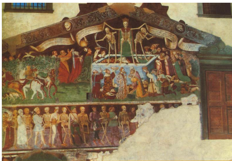
Fig. 6. — Giacomo Borlone de Bruschi, 1485: il Trionfo della Morte e la Danza Macabra , considerati la più importante espressione della pittura a soggetto lugubre europeo. (Clusone, in provincia di Bergamo, affreschi sulla parete esterna dell'Oratorio di San Bernardino dei Disciplinati).