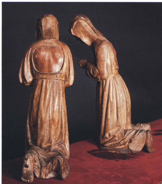
Fig. 3. — Disciplinati vestiti con abiti che lasciano intravedere la schiena scoperta, pronta ad accogliere la frusta. (Sculture lignee provenienti dalla Confraternita dei Disciplinati di Asola, in provincia di Mantova, ora nel Museo della Cattedrale della città).