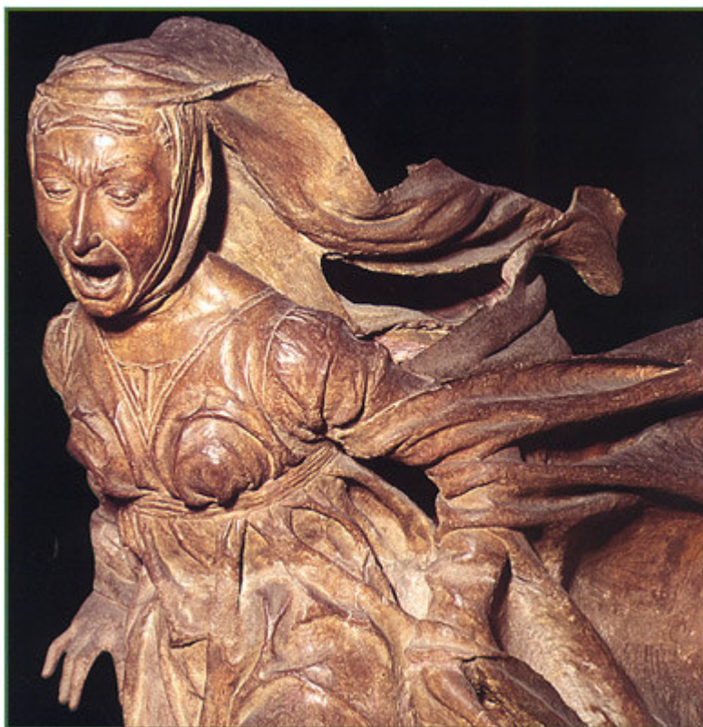
Fig. 5. — Niccolò dell'Arca, (†1494): Maria Maddalena , particolare del Compianto sul Cristo depresso , considerato la più importante terracotta del Rinascimento italiano. (Bologna, Santuario di Santa Maria della Vita, già oratorio disciplinato di San Vito).